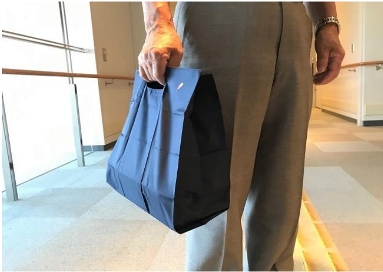
エコバッグ参考写真①