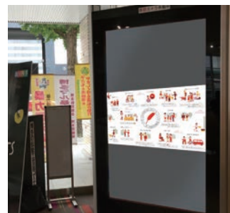
福岡商工会議所デジタルサイネージ