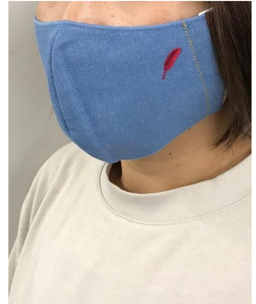
デニムマスク参考写真