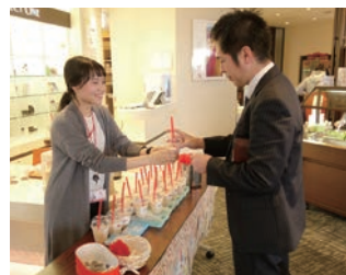
※写真は2019年のものです。

新日本製薬では、“社会に必要とされ続ける会社”であることが企業の存在意義と考え、社会貢献活動に取り組んでいます。今回の社内募金は、この活動が自分たちの住む地域で役立てられていることを知ってほしいと思い企画しました。今後も、活動の輪をまずは社内から広めていきたいと思ひます。