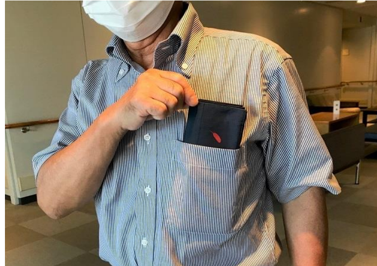
エコバッグ参考写真②折りたたみサイズ